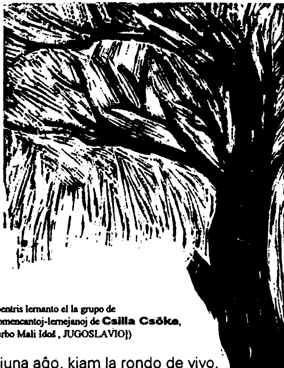
(pentris lemanito el la grupo de komencantoj-lernejanoj de Csilla Csöke , [urbo Mali Idoŝ, JUGOSLAVIO])